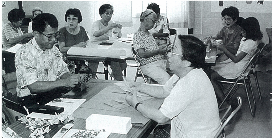
中央公園ふれあいセンターの折り紙教室