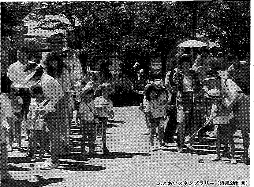
ふれあいスタンプラリー (浜風幼稚園)

幼児期には「楽しさ」こそが育ちの原点と位置づけ、子どもが、十分満足感を得られるよう、幼児の個性を大切にしながら保育をめざしています。 今回は、友だちとの遊びや、地域のかたがたとの交流を通して、社会のルールを学んだり、生き物について考えたりしている市内の幼稚園の取り組みを紹介いたします。