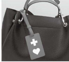
ヘルプマーク(タグ)

外見からはわからなくても援助や配慮を必要としている人(内部障がいのある人・義足を使用している人等)が、周囲の人に配慮を必要としていることを知らせるマークです。希望する人には窓口にて無料でお渡しします。障がい者手帳等の有無も問いません。代理の人でも受付可能です。