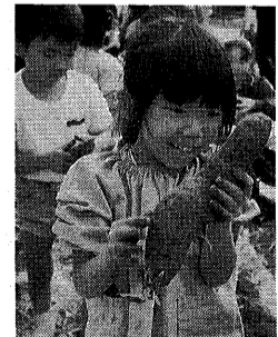
大きなサツマイモにびっくり

「オオカマキリはここでつかまえたんだよ」「コオロギとかね、バッタとかがね、いっぱいいたんだよ」目をきらきら輝かせて話す子どもたちに案内してもらったのが園舎の裏の空き地です。虫探しをしたり、落ち葉拾いをしたり、どろんこ遊びができる、子どもたちのお気に入りの活動場