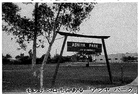
モンテベロ市にある「アシヤパーク」