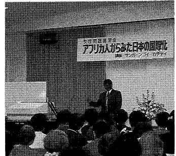
アフリカ人からみた日本の国際化