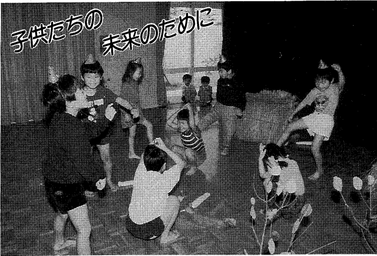
生活発表会 (大東保育所)