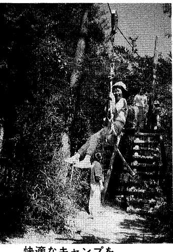
快適なキャンプを野外活動センターで

大東町市営住宅の南地区建て替えの第四年度事業として、第一種住宅十七戸、第二種住宅二十八戸の建設にかかっています。また、北地区に建て替える第二年度事業として、第一種住宅一棟、第二種住宅一棟を建設します。