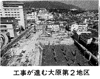
工事が進む大原第2地区

一昨年から整備中の川西線「川西町さくら通り」が本年度全区間が完成します。また、従前から懸案でありました駅前線の緑化改修整備計画を具