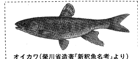
オイカワ(柴川省造著「新沢魚名考」より)