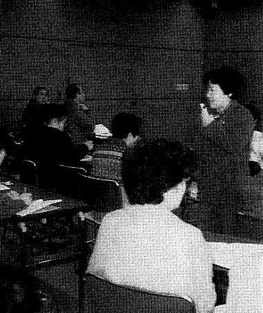
セカンドカレッジが併設される「芦屋川カレッジ」

六十年以上の市民を対象とした芦屋川カレッジの修了者の中から、いつまでも学習を継続していただけるよう、本年度から「芦屋川セカンドカレッジ」を併せて開設します。