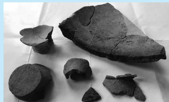
今回の確認調査で出土した弥生土器(左下の5片)と古代の瓦(右上の1点)

船戸遺跡は、JR芦屋駅の北西350メートル付近にあり、現在は住宅地の下に埋まっています。昭和30年代の道路工事に土器が見つかったことで発見されましたが、その後、発掘調査を実施する機会がほとんどなく、遺跡の内容はあまりよく分かっていませんでした。