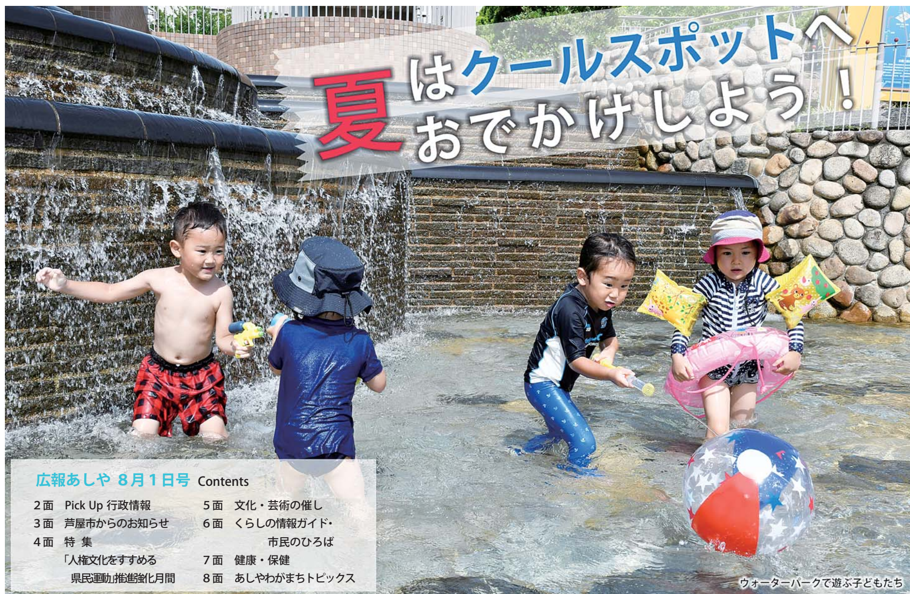
ウォーターパークで遊ぶ子どもたち