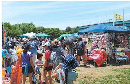
昨年の春の大園遊会の様子

■日時 5月22日(日) 午前10時～午後4時(荒天中止) ■会場 総合公園内 ■内容 フリーマーケット/防災・防犯の展示や体験コーナー(仮)/花苗交換/音楽ステージ/飲食ブース/運動会必勝塾