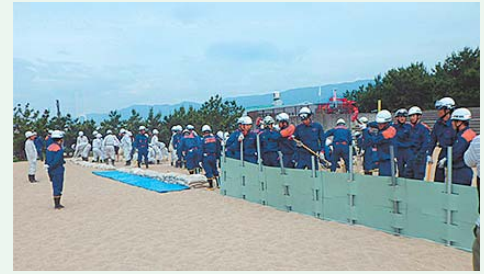
昨年の水防訓練の様子

■日 時 5月24日(火)午前10時～11時 ■場 所 潮芦屋ビーチ西側 ■参加機関 芦屋市・消防本部・消防団 ■問い合わせ 消防本部警防課 ☎32-2345