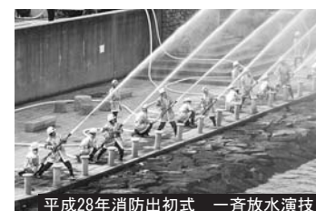
平成28年消防出初式 一斉放水演技

消防団活動は消火活動の他に、広報活動や防災活動、応急手当の普及・指導、各地域の自主防災組織での訓練指導など、さまざまな活動があります。あなたも大切な命を守るために、そして自分が育ち、自分が暮らし、自分が働く大切な町を守るために、消防団活動に参加してみませんか！