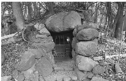
芦屋神社境内古墳

この古墳は、水神社として芦屋神社境内の南西端にあり、自由に見学できます(石室内は非公開)。