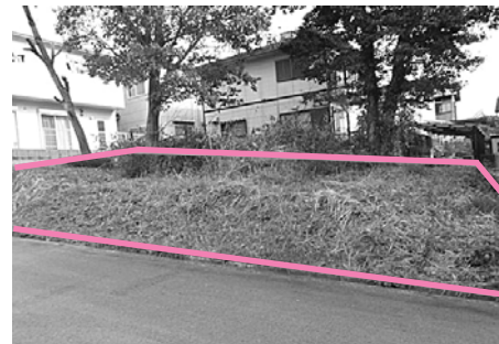
①三重県津市稲葉町字牧野