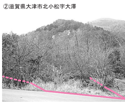
②滋賀県大津市北小松字大澤