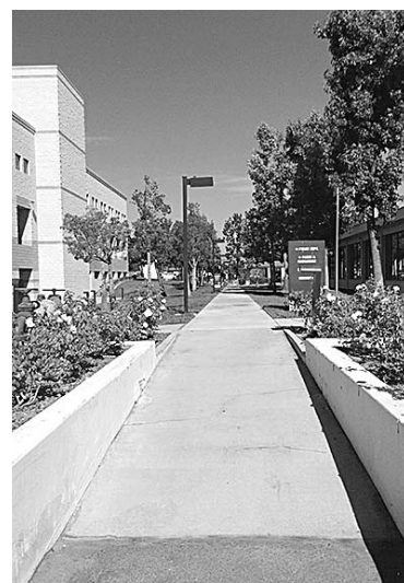
モンテペロ市にある「アシヤウェイ」

観光旅行では味わえない、姉妹都市交流と、アメリカの有名都市を訪れる旅にぜひご参加ください。