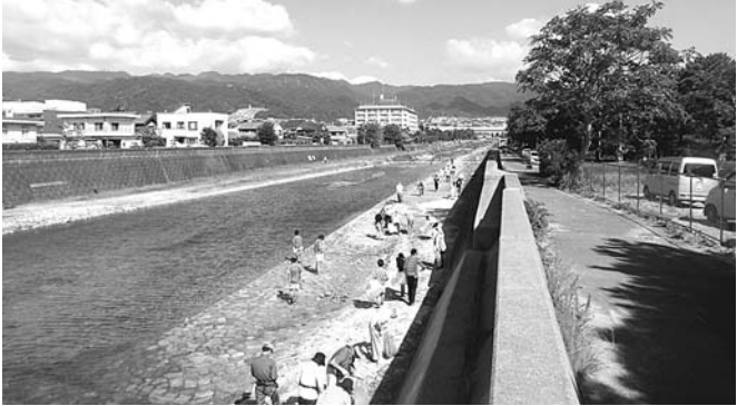
9月28日(日)、秋の芦屋わがまちクリーン作戦が開催されました。「まちも心も美しく」をモットーに、芦屋川河川敷の清掃活動が行われ、270人のかたが参加しました。

発行/ 芦屋市役所(広報国際交流課) TEL.0797-31-2121/FAX.0797-38-2152 〒659-8501兵庫県芦屋市精道町7番6号 ホームページ http://www.city.ashiya.lg.jp/ メールアドレス info@city.ashiya.lg.jp