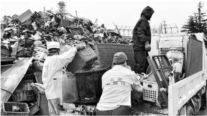
8月20日(水)から丹波市へ災害応援職員を派遣 8月16日からの集中豪雨で甚大な被害を受けた丹波市へ、給水・健康対策・災害ごみ運搬等の業務に職員を派遣しています。

発行/ 芦屋市役所(広報国際交流課) TEL.0797-31-2121/FAX.0797-38-2152 〒659-8501兵庫県芦屋市精道町7番6号 ホームページ http://www.city.ashiya.lg.jp/ メールアドレス info@city.ashiya.lg.jp