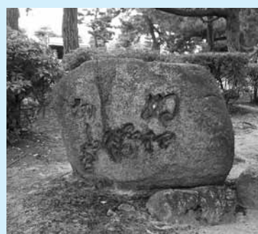
ぬえ塚の石碑(芦屋公園内)

ぶようになりまし。それが現在、芦屋公園内(浜芦屋町)にあるぬえ塚の石碑(写真の由来ですが、これは大正6年(1917)に作られたもので、江戸時代の地誌である「撰津名所図会」では、「芦屋川と住吉川の間」にあり今さだかならず」と記されています。各地には、ぬえの伝説がいくつかわかっています。大阪府東区にもぬえ塚があり、大正13年(1924)に刊行された「芦屋」には芦屋の伝説と同様に、丸木舟に乘せられて漂着したぬえの亡骸を吊ったと伝えられています。また、京都市の清水寺の近くに伝わるぬえ塚を、江戸時代に掘り返してしまったため災いが起こった、と文化3年(1806)刊行の「閑田次第」は伝えています。四国では、退治され切り刻まれたぬ