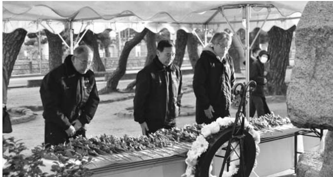
震災19年「1.17芦屋市祈りと誓い」で献花を行いました 1月17日(金)、芦屋公園「慰霊と復興のモニュメント」前に1,233人が訪れ、阪神・淡路大震災で犠牲となったかたへ祈りを捧げました。

発行/ 芦屋市役所(広報国際交流課) TEL.0797-31-2121/FAX.0797-38-2152 〒659-8501兵庫県芦屋市精道町7番6号 ホームページ http://www.city.ashiya.lg.jp/ メールアドレス info@city.ashiya.lg.jp