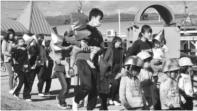
市内全域で全国一斉緊急地震速報訓練を実施しました 11月29日(金)、大東保育所では津波から逃れる緊急地震速報訓練に参加し、避難先の打出浜小学校まで避難しました。

発行/ 芦屋市役所(広報国際交流課) TEL.0797-31-2121/FAX.0797-38-2152 〒659-8501兵庫県芦屋市精道町7番6号 ホームページ http://www.city.ashiya.lg.jp/ メールアドレス info@city.ashiya.lg.jp