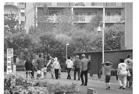
前回の避難訓練のようす(南芦屋浜地区)