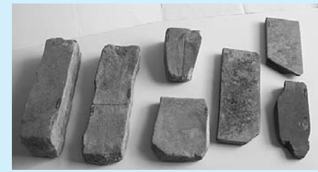
業平遺跡出土の砥石

ここで、六甲山中の採石場から下って、平坦地が広がる業平遺跡に、工具のメンテナンスを行う工房があったと推測できます。さらには、その周辺には、人達が滞在する飯場や、人達が加工する砥石の採石場が展開しており、多くの工人が作業に携わっていました。石を割るには、鑿を使って矢穴を彫り、そこに矢やセリガネと呼ばれる鉄製や木製の工具を入れて、玄能で叩く必要があります。