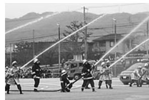
平成25年 芦屋市消防出初め式 一斉放水

■対象 18歳以上50歳未満で市内に在住または在勤のかた ■待遇 市条例に定められる年報酬の支給。災害出動および各種訓練参加に対し手当等の支給。制服貸与・公務災害補償・表彰等の制度あり。