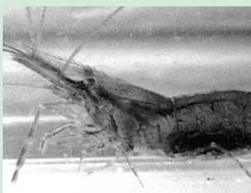
アシナガエビモドキ

生活場所によって体色変化が多く、五月に採集したものは、茶褐色で卵を多く抱えているものが見られました。