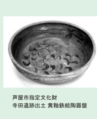
芦屋市指定文化財 寺田遺跡出土 黄釉鉄絵陶器盤

このような特徴から、よく似た発掘品のみられる中国福建省磁窯産のメイトル(の)穴の中に、須恵器の鉢とて。発掘調査で出土した時は、手のひら程度の大きさに割られており、直径三十五センチメートル、深さ三十センチメートルの穴の中に、須恵器の鉢と