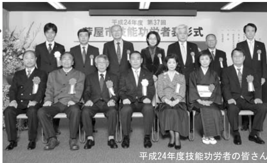
平成24年度技能功労者の皆さん