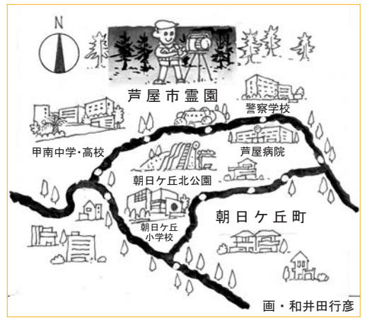
芦屋市霊園から望む夜景

公園墓地として造成された芦屋市霊園。展望台から望む夜景は、西は神戸・東は大阪の市街地、遠くは泉北・阪南の港が一望できます。空気の澄んだ冬の季節、夜空に浮かぶ幻想的な風景に魅了されます。 この時期は、午後4時15分に閉門(車出口は午後4時30分まで)しますが、12月末から1月初旬(前後1週間)は終日(24時間)閉門しています。