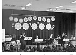
ザ・ローズの活動風景

■日時 4月28日(土) 午前10時30分～正午 ■会場 保健福祉センター3階(多目的ホール) ■内容 ザ・ローズファミリーコンサート「音の動物園」 ■対象 子育て中の保護者と子ども ■定員 先着100組 要予約 ■申し込み 4月11日(水) 午前9時から、電話で子育てセンターへ