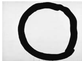
吉原治良「白地に黒い円」(館蔵)

■期間 4月14日～5月27日(月曜日休館) ■会場 美術博物館 講義室 ■内容 吉原治良の没後40年を記念し、代表作「白地に黒い円」を中心に、近年の作品を展示する。直前に連絡。 ■定員 50人 ■参加費 500円(観覧料含む) ■申し込み 4月14日(金)10時迄 ■観覧時間 10時～17時