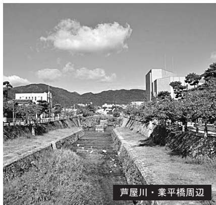
芦屋川・葉平橋周辺

【募集要領】 ■募集人数 一人 ■任期 六月一日～平成二十六年五月三十一日(二年) ■応募資格 市内在住の満二十歳以上の市民(六月一日現在) 一日二万円(百円所得税込み) ■報酬 四月九日～二十三日 必着の平日・執務時間内 ■応募方法 所定の応募用紙に必要事項および、都市計画に関する作文八百字程度を記入し、期間内に持参または郵送で都市計画課へ ■選考方法 応募用紙は返却しません。ご了承ください。結果は本人に通知します。