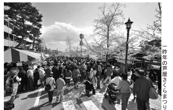
「昨年の芦屋さくらまつり」

当日の運営補助・警備補助・清掃等をお手伝いいただけるかたは、下記へ。 *当日も、本部で受け付けています。