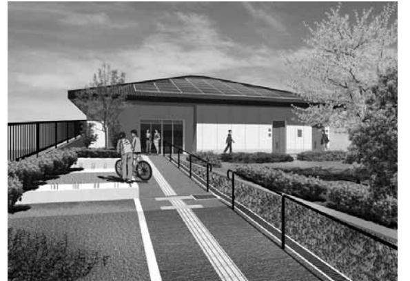
《三条地区集会所・完成予想図》

このほど三条地区集会所が完成し、四月十六日から供用開始することになりました。 お使いいただける部屋は洋室A(17㎡)、洋室B(21㎡)、洋室C(42㎡)、洋室D(44㎡)となっており、洋室Aはミニキッチンを備え、洋室Cと洋室Dは一つの部屋としても使用することが可能です。供用開始に先立ち、四月一日(日)に予約の受け付け、また四月十五日(日)に開所式および見学会を実施します。見学会を希望される方は、四月十五日(日)午後一時から三時までの間、ご自由に観覧ください。