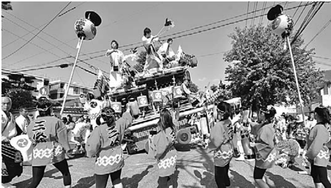
10月9日(日)「第23回あしや秋まつり」が開催されました。秋空の下、会場の精道小学校グラウンド・東側道路では、縁日・だんじり・イベント等に5,500人が参加し、祭りを楽しみました。

発行/ 芦屋市役所(広報課) TEL. 0797-31-2121/FAX. 0797-38-2152 〒659-8501兵庫県芦屋市精道町7番6号 ホームページ http://www.city.ashiya.lg.jp/ メールアドレス info@city.ashiya.hyogo.jp