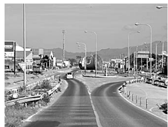
●石巻市(9月18日撮影)・まだまだ手付かずの場所が多く見られる状況

前回に引き続き、八月二十日から九月二十日まで実施した、宮城県石巻市への本市の被災地支援の取り組みについてお知らせします。 【職員等の派遣】 ■市町業務全般支援(宮城県石巻市) 市町業務支援の第二十六陣から第二十九陣として、各二人・計八人の職員を、八月二十日から九月十七日までの間派遣しました。