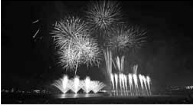
「第33回 芦屋サマーカーニバル」に、約98,500人が参加 7月23日(土)潮芦屋で「芦屋サマーカーニバル」が開催され、 石巻市の小学生らも参加し、多くの人で終日にぎわいました。

発行/ 芦屋市役所(広報課) TEL. 0797-31-2121/FAX. 0797-38-2152 〒659-8501兵庫県芦屋市精道町7番6号 ホームページ http://www.city.ashiya.lg.jp/ メールアドレス info@city.ashiya.hyogo.jp