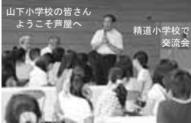
山下小学校の皆さん ようこそ芦屋へ

一行は、二十二日に石巻市を出発、二十 三日の朝には精道小学校で本市の小学生 らと交流、午後には、人と防災未来セン ター(神戸市)を見学、夜には芦屋サマー カーニバルの花火大会に参加しました。 翌二十四日には、ユニバーサルスタジオジャパンで終日過ごし、 二十五日の朝、家族の待つ石巻市へと帰りました。