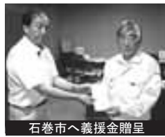
石巻市へ義援金贈呈

■東北地方太平洋沖地震災害義援金募集委員 会では、四月の第一次義援金に引き続き、七月 十一日、宮城県石巻市に、市民の皆さんから寄 せられた義援金一千二百万円を進呈しました。 なお、今後とも募金活動は行いますので、引 き続き皆さんのご協力をお願いします。