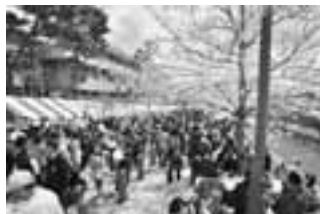
昨年さくらまつり

まつり当日の運営補助・警備・清掃等、お手伝いいただけるボランティアのかたを募集しています。ボランティアに関する問い合わせ・申し込みは、芦屋さくらまつり協議会事務局市民参画課内へ。