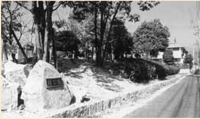
緑町の一角にある緑公園