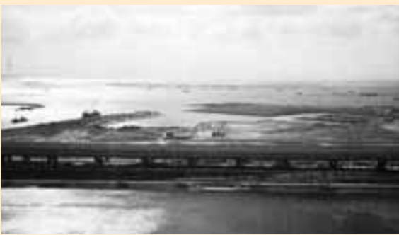
埋め立てがほぼ完成した(当時)南芦屋浜地区