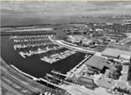
新しい芦屋のまち (海洋町)