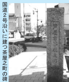
国道2号沿いに建つ茶屋之町の碑