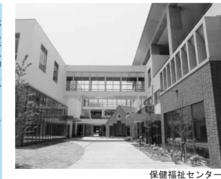
保健福祉センター

シルバークラブについては、シルバークラブは、いつ完成するのか。概要も教えてほしい。今年度中に完成予定で、二階建てで、今のシルバークラブセンターより大きな施設になります。センターの事務所と作業所が入ることになります。就職の相談などの個々の事業内容は、今後の事業方針によって、決定することになります。