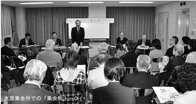
大原集会所での「集会所トーク」

発行/ 芦屋市役所(広報課) TEL. 0797-31-2121 FAX. 0797-38-2152 〒659-8501兵庫県芦屋市精道町7番6号 ホームページ http://www.city.ashiya.lg.jp/ メールアドレス info@city.ashiya.hyogo.jp