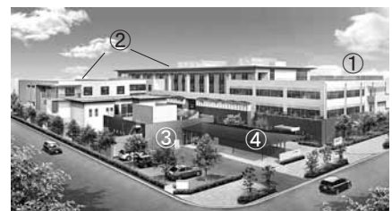
【全体図の施設名】 ①木口ユニバーサルセンター ②市福祉センター ③あしや温泉 ④足湯施設