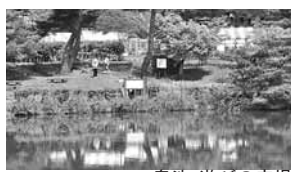
奥池・遊びの広場

搬入時、ブースへの車の乗り入れはできません。指定された駐車場から、出店者で品物を運んでください。