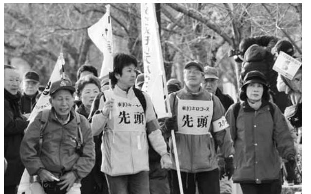
ひょうごメモリアルウォーク2009

問い合わせ ひょうご安全の日推進県会議事務局 ☎078-362-9984/FAX 078-362-9876