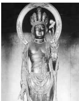
国宝 木心乾漆十一面観音立像