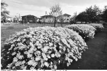
潮芦屋・ユリオオプスデザイン

■応募方法 応募作品の裏面に、住所・氏名・年齢・電話番号・作品タイトル(撮影場所)・撮影年月日を明記の上、四月五日(月) 消印有効 までに、郵送または持参で広報課へ ■選考方法 選定委員会を開催し、各期ごとに二十点程度を選考します。 ■その他 作品は、未発表の写真に限ります。応募作品の使用権は市に帰属します。作品は返却いたしませんので、ご了承ください。