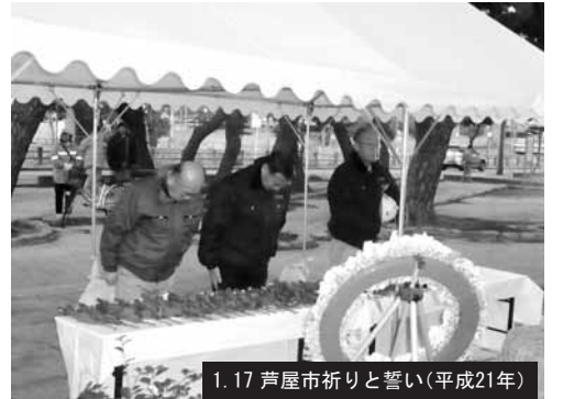
1.17 芦屋市祈りと誓い(平成21年)