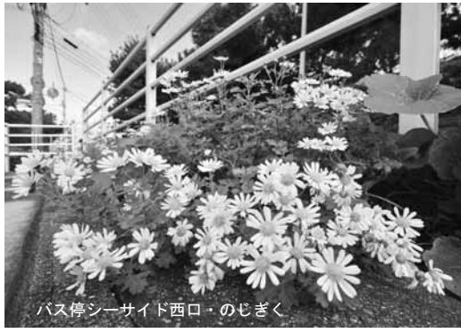
バス停シーサイド西口・のじぎく

■応募方法 応募作品の裏面に、住所・氏名・年齢・電話番号・作品タイトル(撮影場所)・撮影年月日を明記の上、四月五日(月) 消印有効 までに、郵送または持参で広報課へ ■選考方法 選定委員会を開催し、各期ごとに二十点程度を選考します。 ■その他 作品は、未発表の写真に限ります。応募作品の使用権は市に帰属します。作品は返却いたしませんので、ご了承ください。