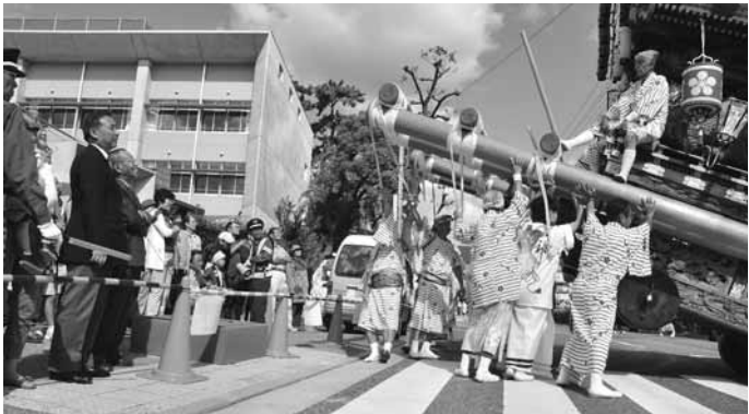
秋晴れのなか「第21回 あしや秋まつり」が開催されました 10月11日(日)「あしや秋まつり」が精道小学校グラウンドで 開催され、さわやかな秋空の下、6,000人の市民が参加しました。

発行/ 芦屋市役所(広報課) TEL. 0797-31-2121 FAX. 0797-38-2152 〒659-8501兵庫県芦屋市精道町7番6号 ホームページ http://www.city.ashiya.hyogo.jp/ メールアドレス info@city.ashiya.hyogo.jp