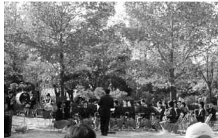
昨年の西浜公園紅葉コンサート

【環境体験館で地球温暖化防止を学ぶ】 日 12月2日(水)8時20分~17時 所 芦屋環境体験館 所 自然観察 所 芦屋 所 15人 費 3,000円 所&問 地球温暖化防止活動推進員・岩野 ☎23-1350