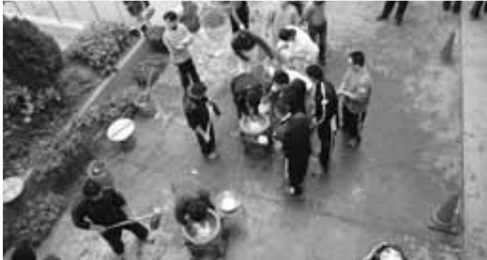
朝日ヶ丘コムスク合同防災訓練(もちつき大会) 12月14日(日)朝日ヶ丘小学校で、朝日ヶ丘コムスク・自主防災会・警察・消防等が参加し、防災・炊き出し訓練を実施しました。

発行/ 芦屋市役所(広報課) TEL. 0797-31-2121 FAX. 0797-38-2152 〒659-8501兵庫県芦屋市精道町7番6号 ホームページ http://www.city.ashiya.hyogo.jp/ メールアドレス info@city.ashiya.hyogo.jp