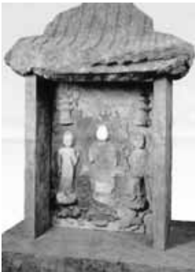
石造浮彫如来及両脇侍像 (加西市・重要文化財)

文化財防火デーの制定は、昭和24年1月26日に、現存する最古の木造建造物である法隆寺(奈良県斑鳩町)の金堂が炎上し、壁画が焼損したことを契機として昭和30年に定められました。