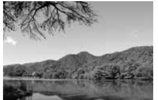
初冬の奥山 ～奥池・奥山貯水池～

芦有道路展望台では、山の木立の向こう側に、初冬の日差しを受けて水面がキラキラ輝く奥池と奥山貯水池を見ることができます。