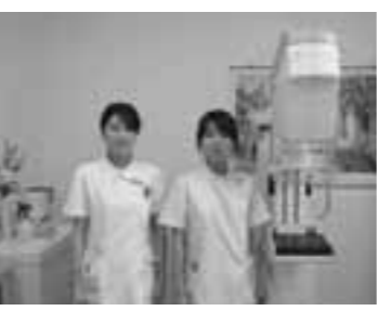
撮影を担当する女性検診認定技師2人とマンモグラフィの撮影装置