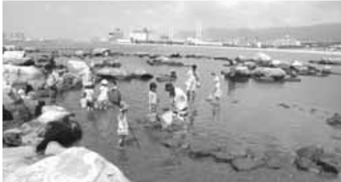
第1回 ビーチライフふれあいフェスティバルを開催 サマーカーニバルの一環として、7月19日・20日、「体験カヌー教室」 「みんなの浜辺調査」等が今年初めての試みとして実施されました。

発行/ 芦屋市役所(広報課) TEL. 0797-31-2121 FAX. 0797-38-2152 〒659-8501兵庫県芦屋市精道町7番6号 ホームページ http://www.city.ashiya.hyogo.jp/ メールアドレス info@city.ashiya.hyogo.jp