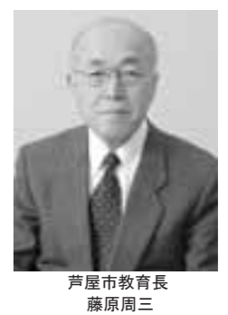
芦屋市教育長 藤原周三

平成二十年一月に、中央教育審議会から学習指導要領改訂に向けた答申が出されました。その中で、「生きる力」をはくむという基本理念は、新しい学習指導要領においても変わりません。本市においては、「生きる力」を