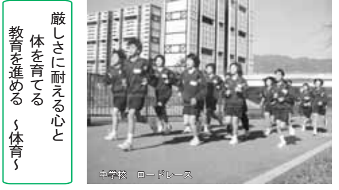
中学校 ロードレース

教師自ら研究と修養に努め、実践的指導力の向上を図る 教職員は、豊かな人間性の育成に努め、「教師力」を高めるために研究と修養に努めます。 打出教育文化センターの様々な研修講座等を活用し、教職員の資質と実践的指導力の向上を図ります。