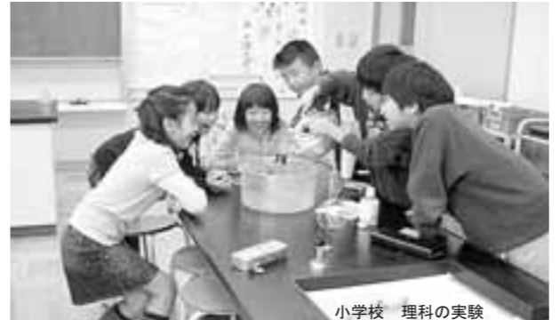
小学校 理科の実験

豊かな「人間力」をはくむ 学校園づくりに努める 学校の説明責任を果たし、保護者や地域の人々との信頼関係を築くため、「子ども読書の街」づくりに取り組めます。 家庭・地域と連携し、子どもの安全を守る取り組みを進めます。「自分の命は自分で守る」という姿勢をはくんでいきます。