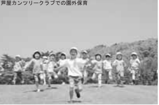
芦屋カンツリークラブでの園外保育

基礎・基本の確実な定着と個性や能力を伸ばす教育を進める チューター(学習指導員)を配置し、基礎・基本の確実な定着を図ります。教育ボランティアや地域の教育力を活用します。 特別支援教育の充実を図ります。