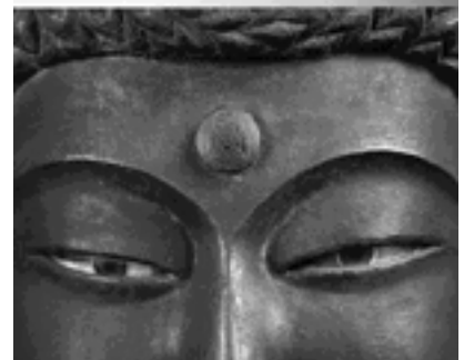
木造釈迦如来立像(重要文化財) 撮影・寿福 滋 / 莊嚴寺(近江八幡市)