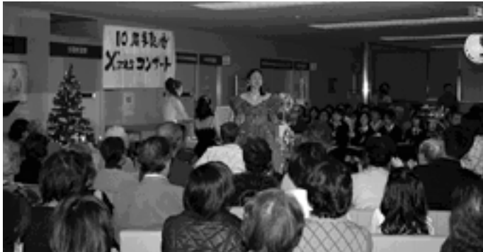
「10周年記念・マチネーコンサート」が開催されました 昨年12月、芦屋病院で毎月開催されているマチネーコンサートが10周年を迎え、患者さんやご家族が記念コンサートを楽しみました。

発行/ 芦屋市役所(広報課) TEL.0797 31 2121 FAX.0797 38 2152 〒659 8501兵庫県芦屋市精道町7番6号 ホームページ http://www.city.ashiya.hyogo.jp/ メールアドレス info@city.ashiya.hyogo.jp