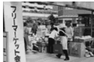
資源保護についてみんなで考えよう

不用品や手作り品を有効活用し、併せて「ごみの減量化」や「資源保護」への関心を高めることを目的として、フリーマーケットを開催します。