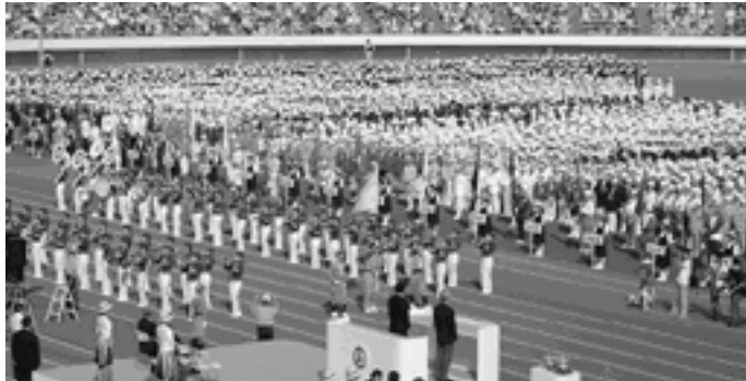
感謝をこめて「のじぎく兵庫国体」開幕 <神戸ユニバー記念競技場> 9月30日(土)、阪神・淡路大震災から11年を経て全国から集う人たちに支援の感謝を伝える「復興国体」が開幕。天皇・皇后両陛下をお迎えした開会式には、約41,700人が参加しました。

発行/ 芦屋市役所(広報課) TEL.0797 31 2121 FAX.0797 38 2152 〒659 8501 兵庫県芦屋市精道町7番6号 ホームページ http://www.city.ashiya.hyogo.jp/ メールアドレス info@city.ashiya.hyogo.jp