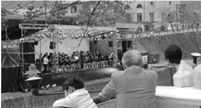
「第18回 芦屋さくらまつり」が開催されました 4月1日(土)・2日(日)、芦屋川畔(業平橋北)でさくらまつりが開催され、約57,000人が緑の日イベントを楽しみました。

発行/ 芦屋市役所(広報課) TEL.0797 31 2121 FAX.0797 38 2152 〒659 8501 兵庫県芦屋市精道町7番6号 ホームページ http://www.city.ashiya.hyogo.jp/ メールアドレス info@city.ashiya.hyogo.jp