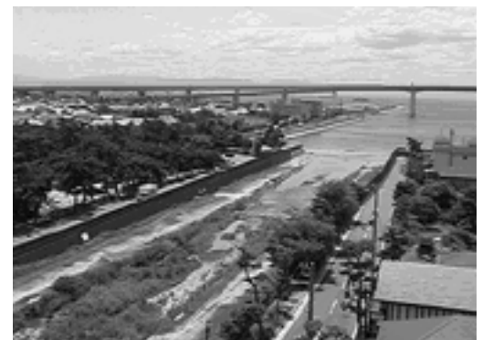
市民に愛され続ける芦屋川

今年も、桜の季節がめぐってきました。この季節、朝日ヶ丘町の霊園やさくら参道、茶屋之町の駅前通り、川西さくら通りなどをはじめ市内のあちこちで美しい桜の花と出会い、春の到来をしみじみと感じます。