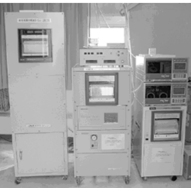
潮見小学校局に設置の計測機器。左から、風向・風速計、中央が 二酸化窒素を計測する「窒素酸化物計」、右は を計測する「二酸化硫黄・浮遊粒子状物質計」。