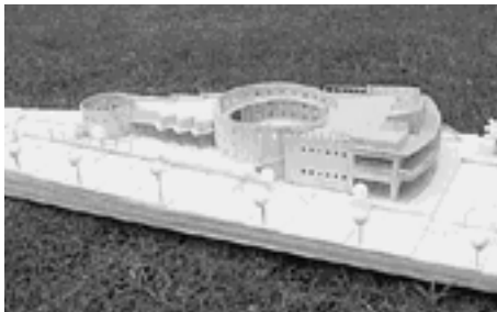
旧山手幼稚園跡の保育園完成予想模型

保育所の待機児童解消のため、浜風小学校の余剰教室と旧山手幼稚園に保育所を開設する社会福祉法人を募集したところ、県下から九法人の応募がありました。 浜風小学校では、保育所として使用する校舎一階の四教室を改装し、三歳以上の幼児を対象とした、六十人定員の保育所が、「浜風夢保育園」として、十月一日から開所します。 また、旧山手幼稚園跡地には、平成十九年四月一日開所にむけ、地域子育て支援事業や一時保育事業なども行える、〇歳から五歳までの幼児を対象とした定員百二十人の保育所が建設される予定です。