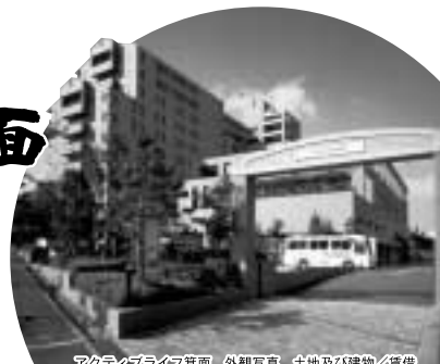
アクティブライフ箕面 外観写真 土地及び建物/賃借