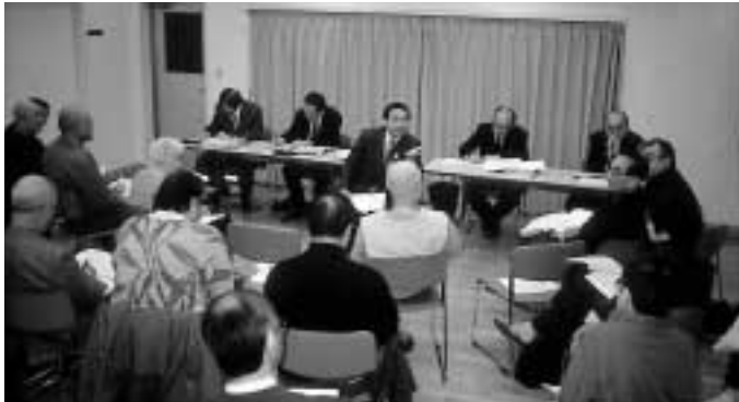
集会所トークに、262人の皆さんが参加しました 1月24日から2月10日、13会場にわたって開催された「集会所トーク」には262人の市民の皆さんが参加し、市長と行政改革やまちづくりについて熱心に話し合いが行われました。

発行/ 芦屋市役所(広報課) TEL. 0797 31 2121 FAX. 0797 38 2152 〒659-8501兵庫県芦屋市精道町7番6号 ホームページ http://www.city.ashiya.hyogo.jp/ メールアドレス info@city.ashiya.hyogo.jp