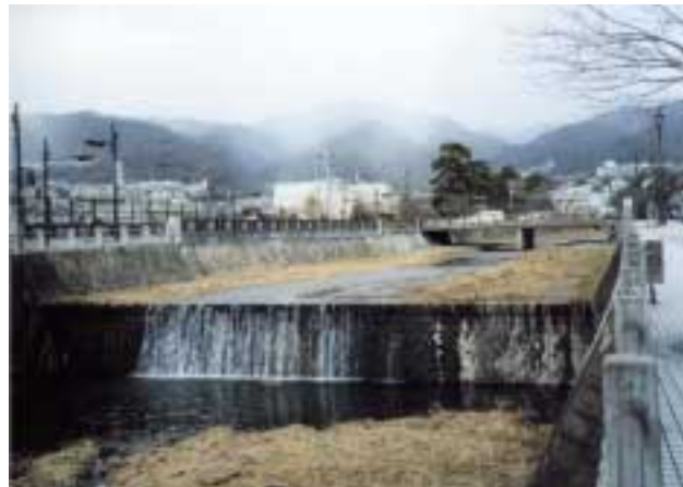
芦屋川(JR芦屋川トンネル上部)