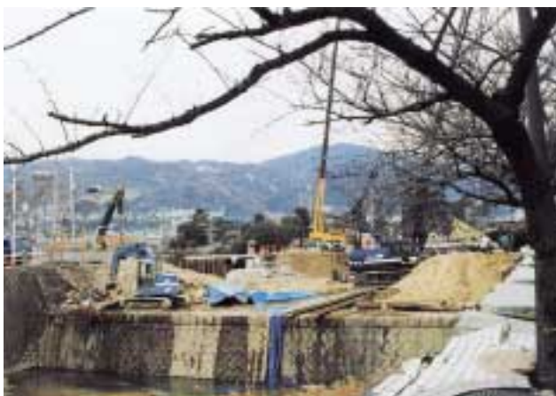
平成7年1月・震災直後